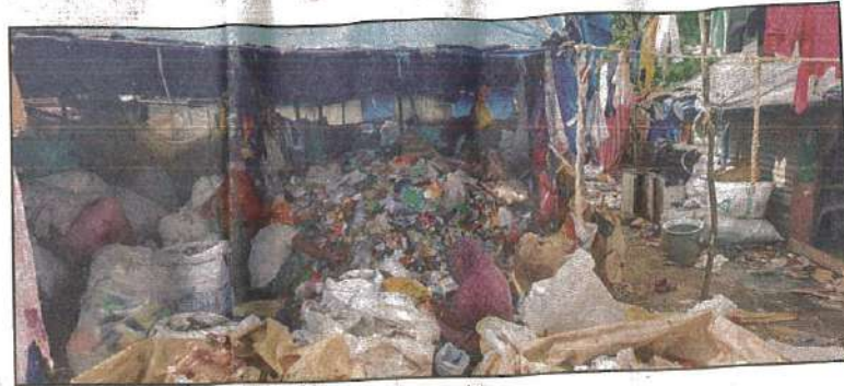
ಟೆಂಟ್‌ನಲ್ಲಿ ಕಸ ಸಂಸ್ಕರಣೆಯಲ್ಲಿ ನಿರತರಾಗಿರುವ ಕಾರ್ಮಿಕರು.

ಈ ಪ್ರದೇಶದಲ್ಲಿ ಕಾಣ ಸಿಗುವವರು ಕಾರ್ಮಿಕರು ಮಾತ್ರ. ಯಾರೊಬ್ಬರನ್ನು ಕೇಳಿದರೂ ಸಮರ್ಪಕ ಮಾಹಿತಿ ನೀಡುವುದಿಲ್ಲ. ಕಸಸಂಸ್ಕರಣೆ ಪ್ರಕ್ರಿಯೆಯ ನಿಯಂತ್ರಿಸುವವರು ಬೇರೆಲ್ಲೋ ಇದ್ದು ಎಲ್ಲವನ್ನೂ ನಿಭಾಯಿಸುತ್ತಾರೆ. ಆದರೆ, ಕಾರ್ಮಿಕರ ಬದುಕು ಮಾತ್ರ ನಿತ್ಯವಾಗಿದೆ. ಕಸದ ಮಧ್ಯೆಯೇ ಇರುವ ಚಿಕ್ಕ ಟೆಂಟ್‌ಗಳಲ್ಲಿ ಅವರು