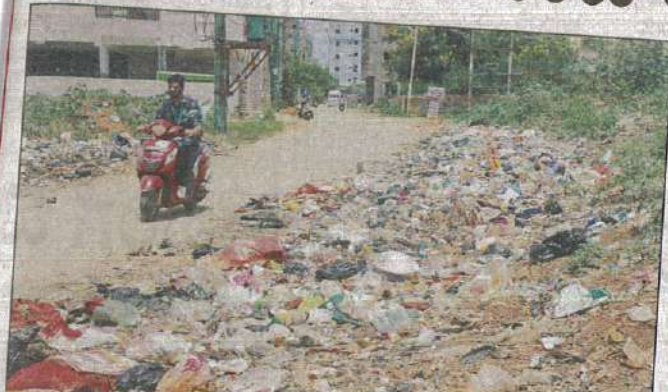
ಶಿಕಾರಿಪಾಳ್ಯದ ರಸ್ತೆಯೊಂದರಲ್ಲಿ ಕಸದ ರಾಶಿ.

ಮಳೆಗಾಲದಲ್ಲಿ ಸಾಂಕ್ರಾಮಿಕ ರೋಗ ಹಬ್ಬಾಗಿ ಹರಡಲಿದೆ. ಇಂತಹ ಸಮಯದಲ್ಲಿ ಸ್ವಚ್ಛತೆಗೆ ಹೆಚ್ಚಿನ ಗಮನ ಕೊಡಬೇಕಾಗಿದೆ. ಕಸದ ರಾಶಿಯನ್ನು