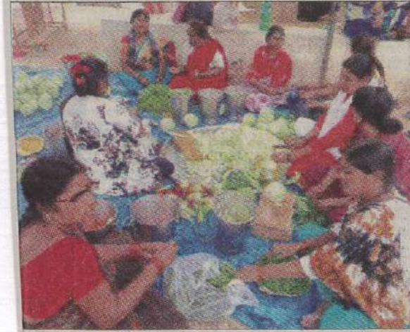
ದಂಪತಿಗಳಲ್ಲಿ ಕಳೆದ 7 ದಿನಗಳಿಂದಲೂ ಅಂಗನವಾಡಿ ಕಾರ್ಯಕರ್ತೆಯರು ತಿಬ್ಬಟನೆ ಮುಂದುವರಿಸಿದರು.

ಸಂ.ಕ.ಸಮಾಚಾರ, ಬೆಂಗಳೂರು ವಿವಿಧ ಬೇಡಿಕೆಗಳನ್ನು ಈಡೇರಿಸಬೇಕೆಂದು ಆಗ್ರಹಿಸಿ ಕಳೆದ ಒಂದು ವಾರದಿಂದಲೂ ನಿರಂತರ ಧರಣಿ ಮುಂದುವರಿಸಿರುವ ಅಂಗನವಾಡಿ ಕಾರ್ಯಕರ್ತೆಯರು ಸೋಮವಾರ ತಾವು ಕುಳಿತ ಜಾಗದಲ್ಲೇ ಸಾಮೂಹಿಕವಾಗಿ ತರಕಾರಿ ಕತ್ತರಿಸುವ ಮೂಲಕ ಪ್ರತಿಭಟನೆ ನಡೆಸಿದರು. ಮಹಿಳೆಯವರು ಮನೆಯ ಒಳಗೂ ಮತ್ತು ಹೊರಗೂ ಕೆಲಸ ಮಾಡುವುದು ಇಂದಿನ ದಿನಗಳಲ್ಲಿ ಅನಿವಾರ್ಯವೆನ್ನಿಸಿದ್ದು ಗ್ರಹೀಣೆಯರ ಮೇಲೆ ಜವಾಬ್ದಾರಿಯೂ ಹೆಚ್ಚಿದೆ ಎಂಬ ಸಂದೇಶ ಸಾರಿದ ಅಂಗನವಾಡಿ ಕಾರ್ಯಕರ್ತೆಯರು ತಮ್ಮ ನ್ಯಾಯಯುತವಾದ ಬೇಡಿಕೆಗಳನ್ನು ಈಡೇರಿಸಲು ಸ್ವತಃ ಮುಖ್ಯಮಂತ್ರಿಯವರೇ ಫೋನ್‌ಪಾರ್ಕ್‌ಗೆ ಬರಬೇಕೆಂದು ಮನವು ಚರಿಸಿದರು. ಅಂಗನವಾಡಿ ಕೇಂದ್ರಗಳನ್ನು ಮೇಲ್ದರ್ಜೆಗೆ ಏರಿಸಬೇಕು. ಗ್ರಾ.ಪಂ.ಟಿ ಸೌಲಭ್ಯ ಒದಗಿಸಬೇಕು. ಸೇವಾ ಭದ್ರತೆ ನೀಡಬೇಕು. ವೇತನ ಪರಿಷ್ಕರಣೆಯಾಗಬೇಕು. ಅಂಗನವಾಡಿ ಕೇಂದ್ರಗಳ ಮೇಳಾಪಟ್ಟಿ ಬದಲಾಗಬೇಕು ಸೇರಿದಂತೆ ಮುಂತಾದ ಬೇಡಿಕೆಗಳನ್ನಿಟ್ಟುಕೊಂಡು ನಡೆಸಲಾಗುತ್ತಿರುವ ಕರ್ನಾಟಕ ರಾಜ್ಯ ಅಂಗನವಾಡಿ ನೌಕರರ ಸಂಘದ ಪ್ರತಿಭಟನೆ ಸೋಮವಾರ ಮತ್ತಷ್ಟು ಕಾವು ಪಡೆದುಕೊಂಡಿದ್ದು, ಸರ್ಕಾರದ ವಿರುದ್ಧ ಅಂಗನವಾಡಿ ಕಾರ್ಯಕರ್ತೆಯರ ಅಸಮಾಧಾನವೂ ಹೆಚ್ಚುವಂತೆ ಮಾಡಿದೆ.