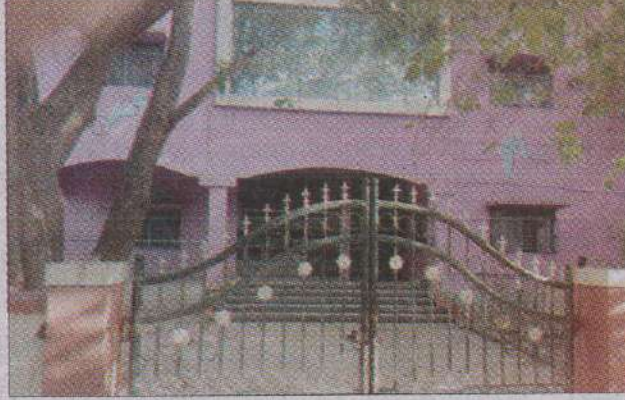
ಚಿತ್ರದುರ್ಗ ಜಿಲ್ಲಾ ಪಂಚಾಯತ್ ಕಚೇರಿ ಪಕ್ಕದಲ್ಲಿ ಮುಚ್ಚಿರುವ ಕ್ರೀಡಾ ವಸತಿ ಶಾಲೆ.

ಏನು ಕಾರಣ: ವಸತಿ ಶಾಲೆಗೆ ಬೇಸಿಗೆ ರಜೆಗೆ ಹಾಕಿದ್ದ ಬೀಗ ಇನ್ನೂ ತೆಗೆದಿಲ್ಲ. ಕಾರಣ ವಸತಿ ಶಾಲೆಯಲ್ಲಿ ತಂಗುವ ವಿದ್ಯಾರ್ಥಿಗಳಿಗೆ ಊಟ ಉಪಾಹಾರ (ಮೆಸ್) ನೀಡುವ ಗುತ್ತಿಗೆ ಪ್ರಕ್ರಿಯೆ ಇನ್ನೂ ಪೂರ್ಣಗೊಂಡಿಲ್ಲ. ಇದು ರಾಜ್ಯಮಟ್ಟದಲ್ಲಿ ಆಗಬೇಕಾಗಿರುವುದು. ರಾಜ್ಯದ ಎಲ್ಲಾ ಜಿಲ್ಲೆಗಳಲ್ಲಿಯೂ ಕ್ರೀಡಾ ವಸತಿ ಶಾಲೆ ಆರಂಭವಾಗಿದ್ದು,